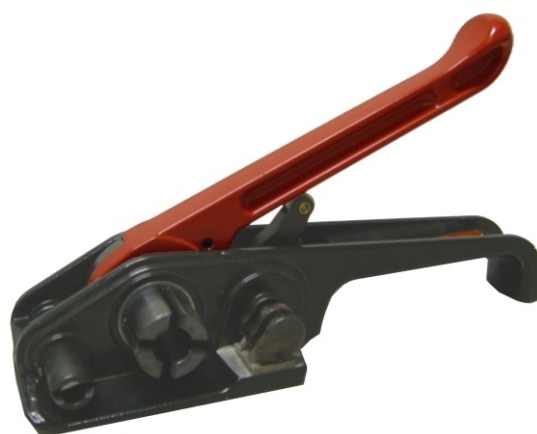
Tensionador de rolete Modelo: WHD