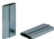
Selo TR para fitas de aço.

Ferramenta seladora com selo tipo "Notch" Duplo